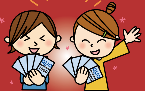
illustration by mino

コンビニエンスストア・ファミリーレストラン・ガソリンスタンド・ドラッグストア・書店など、誰もが普段行くお店 (全国 36,000 店) でQUOカードを活用してください!